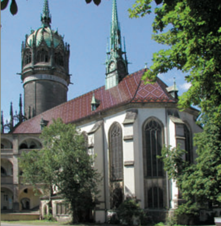
Schlosskirche zu Wittenberg, Foto: Lutherstadt Wittenberg