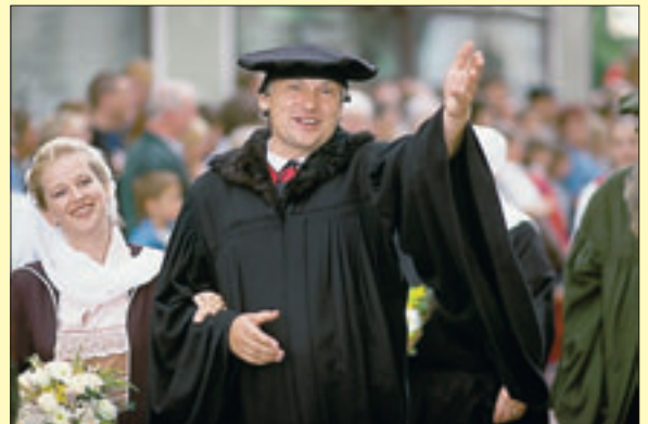
„Martin Luther“

Bevor wir die Heimreise antreten, begeben wir uns jedoch noch auf die Spuren Martin Luthers in Wittenberg. Wir besuchen die Originalschauplätze der Reformation, sehen die historische Altstadt mit ihrer Schlosskirche (Innenbesichtigung) und der berühmten Thesentür, bummeln durch Straßen, die auch Luther und seine Mitstreiter schon durchschritten haben. Im Anschluss treten wir die Heimreise an. Rückankunft Rostock ZOB ca. 18.00 Uhr.