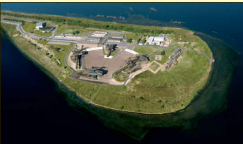
„Die Stadt aus Eisen“ – Ferropolis, Foto: www.ferropolis.de

Einzelzimmerzuschlag: 40,00 €. Eintrittsgelder sind nicht im Fahrpreis enthalten. Änderungen im Reiseablauf behält sich der Reiseveranstalter vor. Bitte beachten Sie unsere Hinweise auf der Seite 4 und unsere Reisebedingungen auf den Seiten 170 und 171.