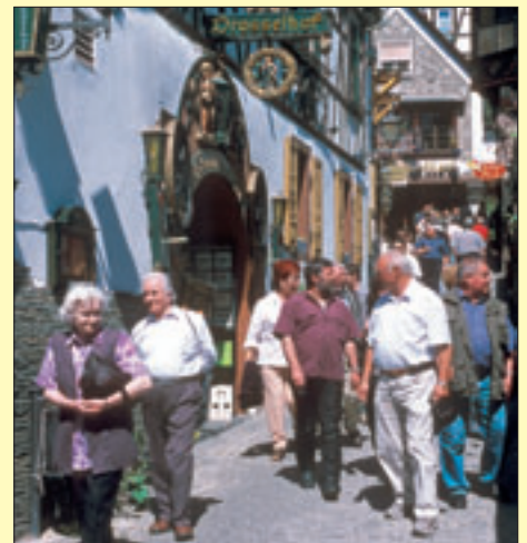
Drosselgasse in Rudesheim